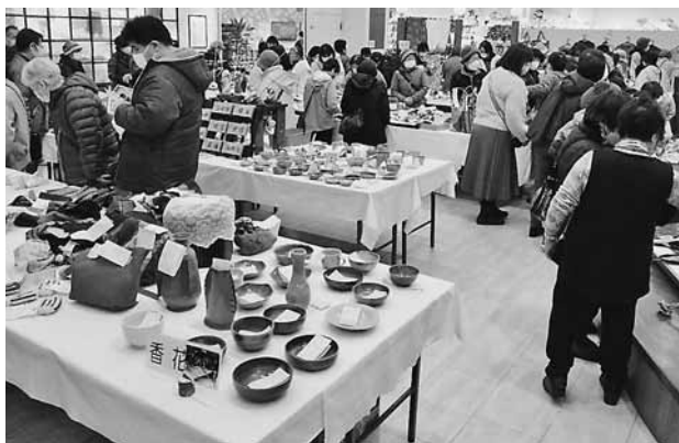
▲ 多くの人で一杯の会場

二日十時には厳かな開会セレモニーが行われました。オープン後は沢山の方が訪れ、作品を手に取り製作者から説明を受けたり、籠一杯に買い物をされる方など、会場はとても賑わっていました。