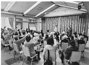
▲ みんなで、じゃんけん大会

玉入れや、新聞紙を足で巻き取るゲーム、じゃんけん大会や、つかみ取りなど盛りだくさんの内容でした。ささやかなプレゼントも用意しており、喜んでいただきました。時間は、瞬く間に過ぎてしまい、「また、会うべな〜。」と、別れを惜しんでいました。