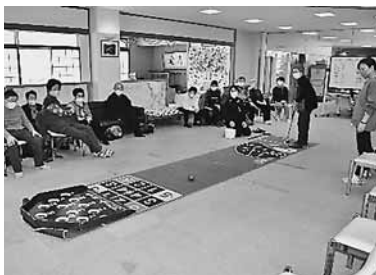
▲ 悠々館でスカットボール

また、三月に今年度最後の交流会が悠々館で開催されています。三月は三回に分けて行います。