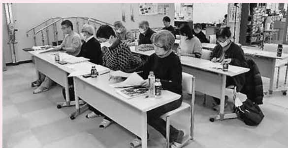
▲ 座学、施設訪問と多岐の研修内容でした

今年度は関心のある町民10名が参加し、司法書士や弁護士などの専門職からの講義の他、事例検討やワークステーション湯田沢内での地域実習を通して学びを深めました。