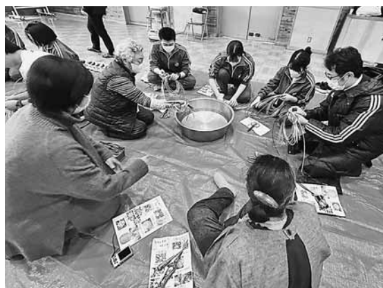
▲ 湯田中学校の様子