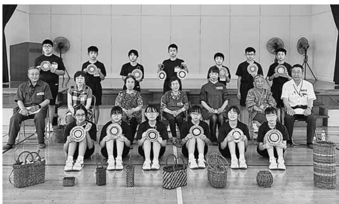
▲ 沢内中学校の様子

参加した中学生からは、「形を整えるのは難しいが、とても面白い」「地元の伝統工芸を初めて知り、また作ってみたい」という言葉や、参加した指導者からも「中学生との交流は元気が出る、先輩たちがつないだ技術を受け継いで欲しい」などと話され、世代間の交流を深めながら、手仕事の楽しさに触れ、伝統をつなぐ大切さを実感しました。