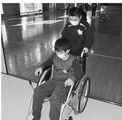
車いすの介助も慎重に行いました

全ての体験を終えて、目が見えない事、体を思うように動かせない事への恐怖が感想として多く、その中で目の見えない人や体の動かない人がどう思うかで生活しているかをみんな考えて、優しくしてあげたいという気持ちを持ったようです。