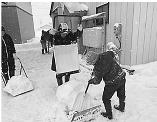
令和3年度 ①上野々地区の活動の様子