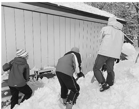
②盛岡からのボランティアによる除雪活動