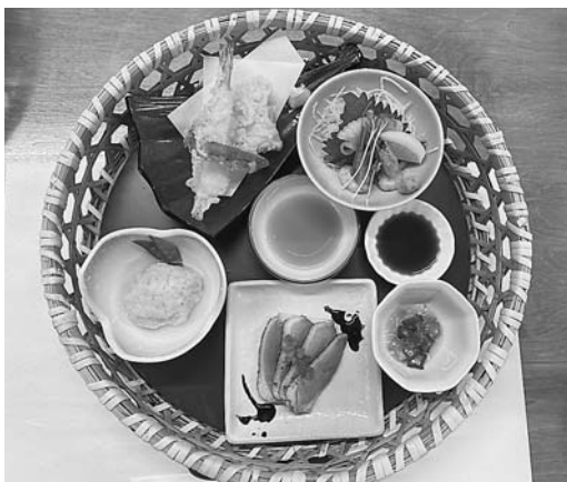
美味しいごはんをいただきました

新型コロナウイルスの影響で参加者の皆さんに満足していただけるような活動ができないのが、悔しいところですが、今後も担当者一同、皆さんが楽しく過ごしていただけるような企画を考えていきたいと思っておりますので、益々たくさんの方の参加をお待ちしております。