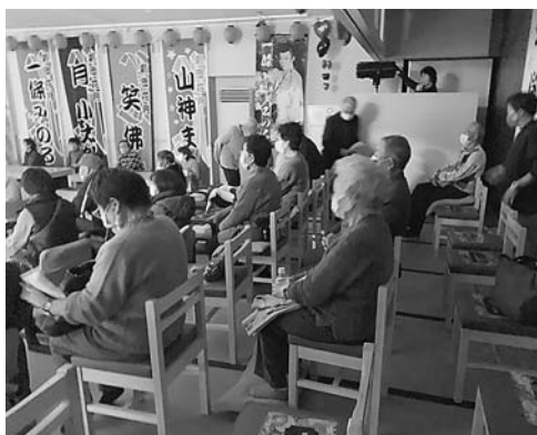
迫力あるステージを観劇中