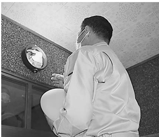
玄関の電気の点検です

また、（有）沢内電業さんからはLEDの蛍光灯と安定器が合わないものを使用すると、そこから火事に繋がるので正しいものを使用しましょうという注意喚起をしていただきました。ご対応いただいた東北電力グループおよび町内事業者の皆さま大変ありがとうございました。