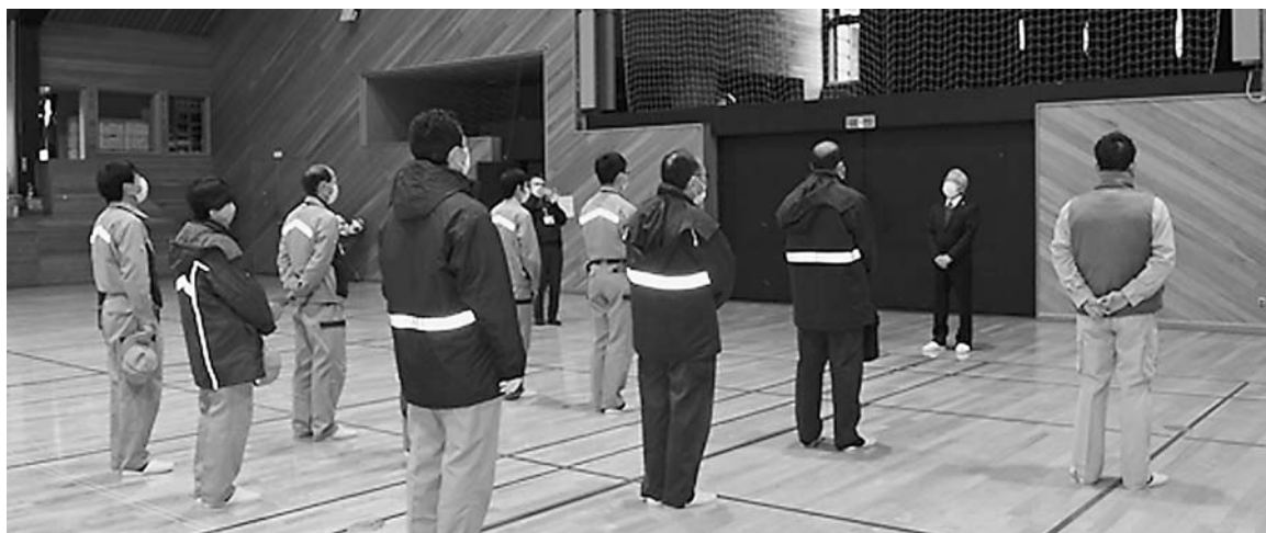
「出発の様子」 11/30は、3班に分かれての活動でした