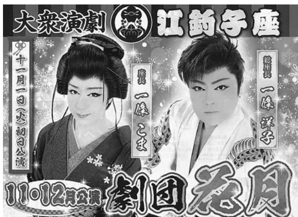
劇団花月さんのチラシ 実物もおきれいでした