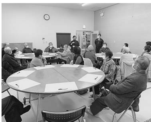
参加者の皆様との交流タイム

新型コロナウイルスの影響で、以前のような町内の方一同に会しての交流会ができなくなり、少し寂しい交流会が続いておりますが、閉じこもってばかりではいけないと思い、今回の交流会は二班に分かれ、「まーす北上」に行ってきました。参加者の皆さんは、冬期間の移動で大変だったと思いますが、久しぶりに会った方々とバスの中でも、会場でも楽しく交流していました。昼食をいただき、食後は大衆演劇を観劇し、楽しい時間を過ごしました。