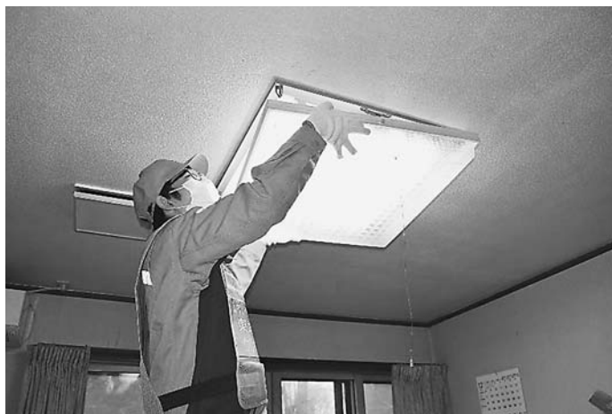
清掃を行ったことでピカピカに