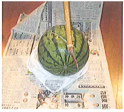
↑ やっと割れたスイカ。皆でいただきました。