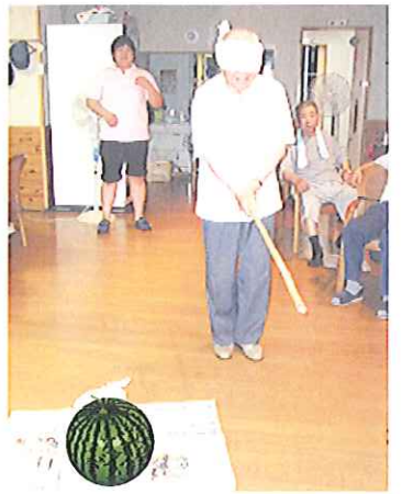
→ 毎年恒例のスイカ割りの様子。そこは全然違うよ〜

利用された方は、「ご馳走が良かった。」 「久しぶりに花火もやって楽しかった。」 「家にいると、大きな部屋に一人で寝ていて、怖いこともあるけれど、皆で寝ていると安心だった。」 などと、今年も大盛況に終わりました。