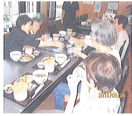
↑お水でかんぱあ〜い

七月三十日～三十一日と八月六日～七日の二回に渡り、今年も悠々館で希望者を募り、宿泊体験が行われました。