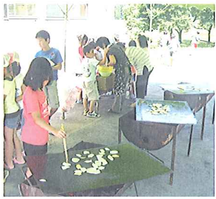
↑おっきな鉄板にたくさん焼きました。

そこで、交流を深めると共に、夏休みの思い出づくりの一環として、両学童クラブの交流会を行いました。 自然に恵まれた沢内学童クラブの敷地に仮設テントを張り、職員、保護者も交えて四十名近い参加者で行いました。三十度を超えるとても暑い中でしたが、バーベキューを行い、お肉や野菜、焼きそばなど、おかわりをしながら、暑さを吹き飛ばすように、たくさん食べていました。 火おこしを手伝ってくれる子や、野菜を焼いてくれる子もいました。 普段会えない友達もいたので、大変楽しそうに盛り上がっていました。