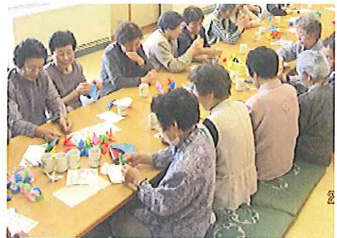
千羽鶴を折る様子

去る六月二十七日(月)に今年度初めての一人暮らし高齢者交流会が悠々館にて開催され、総勢四十九名の方々にご参加いただきました。三月に予定していた交流会が震災の関係で中止となり、半年ぶりの交流会となりました。今回は、七夕を前にしていることもあり、七夕飾りに短冊をつるしたり、東日本大震災の被災地へ送る千羽鶴折りをしたりしました。さすがは、昔取った杵柄、次々と千羽鶴を折り、スズメなど変わり種の折り紙も披露していただきました。