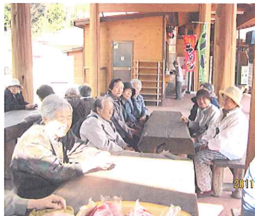
▲春の日差しが暖かいですね～