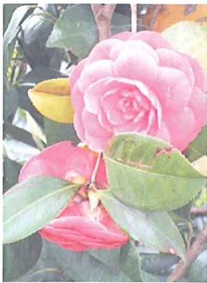
▲利用者の方から頂いた椿 悠々館でも花見が出来ました