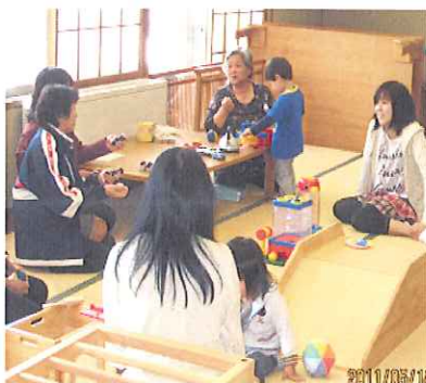
▲仲間づくりの場になっています

す。来月は、手作りおやつの企画があります。また、大運動会も開催予定ですので、ぜひお誘い合わせの上、参加ください。