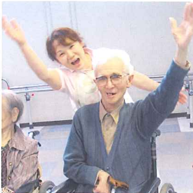
▲楽しみだな♪いってきま～す