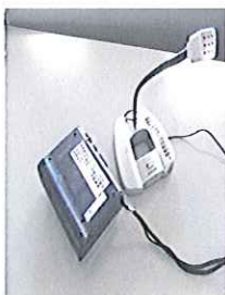
▲新しくなったレコーダー

平成二十一年度共同募金による「福祉のまちづくり支援事業」の配分を受け、録音奉仕グループ『こだま』が、カセットレコーダーとマイクを一〇組購入いたしました。 老朽化の進んでいたレコーダーを更新したことにより、より聞きやすい録音が可能となりました。