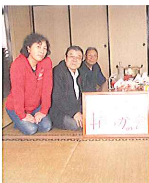
▲輪っかの会のメンバーと

また、ボランティアグループ「輪っかの会」では、調理用品をいただきました。 大切に使用させていただきます。